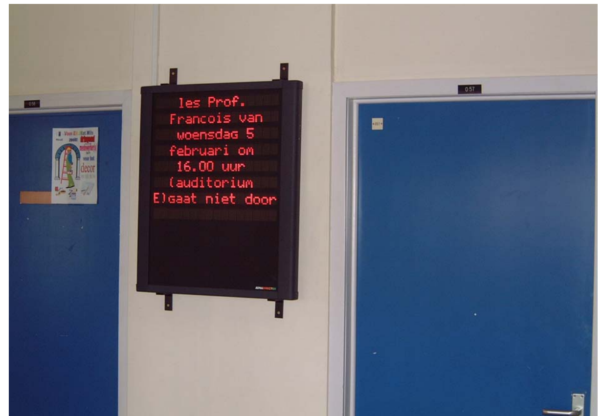
Universiteit Gent – Faculteit Letteren en Wijsbegeerte

op het decanaat en de dienst studentenadministratie van de faculteit.