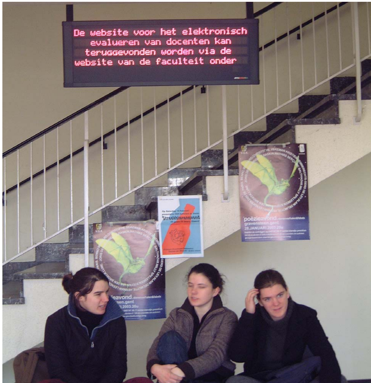
LICHTKRANTEN VOOR STUDENTENINFO